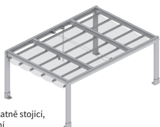
Samostatně stojící, ovládání lanovým převodem