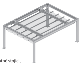
Samostatně stojící, ovládání elektromotorem